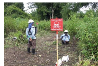
地雷・不発弾対策