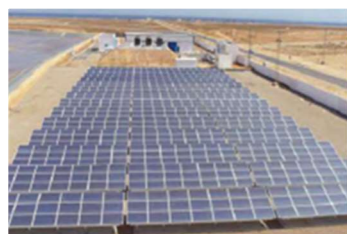
再生可能エネルギー

気候変動への対応・対策、平和構築や治安の安定など、人々を取り巻く様々な環境課題に取り組んでいます。